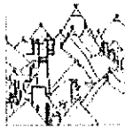
TABELLA A – PERSONALE DI CATEGORIA A/B

SCHEDA DI VALUTAZIONE INDIVIDUALE ANNO 2018